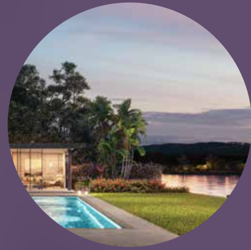
قطع أراضي واسعة