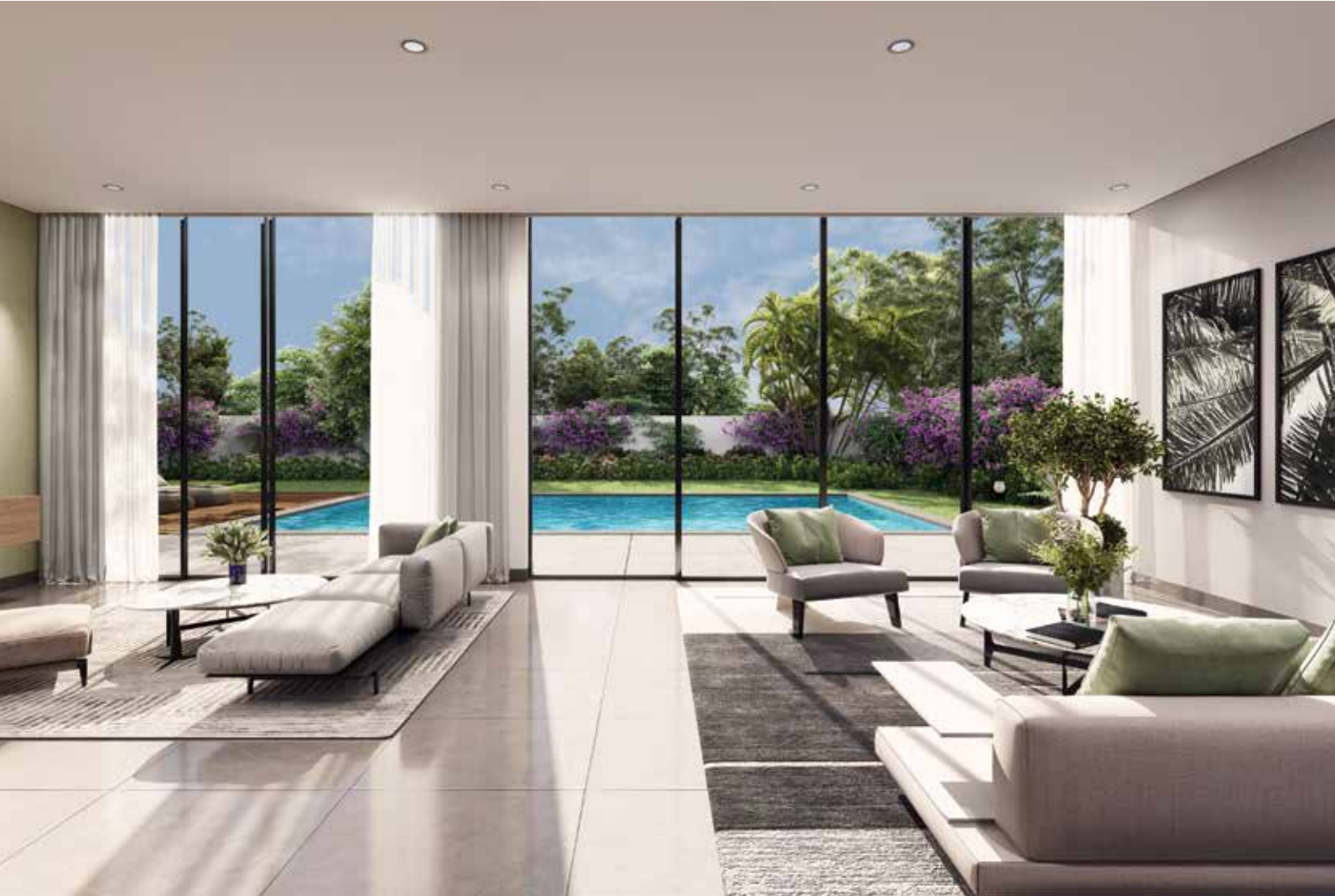
أمارا فلل جزيرة حصرية بـ 5 غرف نوم

نقدّم لكم جزيرة جنان - مجموعة خاصة من الفلل الفخمة وسط حي مجهز ببوابات أمنية للسكان، تمنحهم ملاذاً مثالياً للسكون، والطمأنينة والأناقة العصرية.