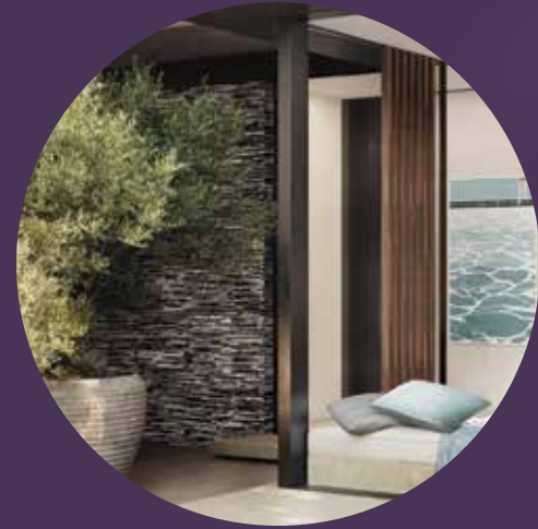
مجالس وساحات خارجية