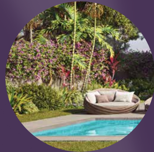
خيارات لتشجير الحديقة