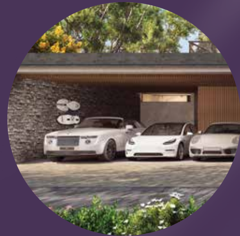
مواقف فسيحة للسيارات