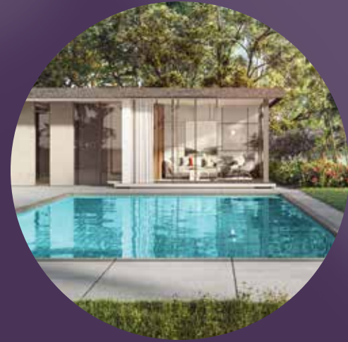
خيارات لبركة السباحة الخاصة