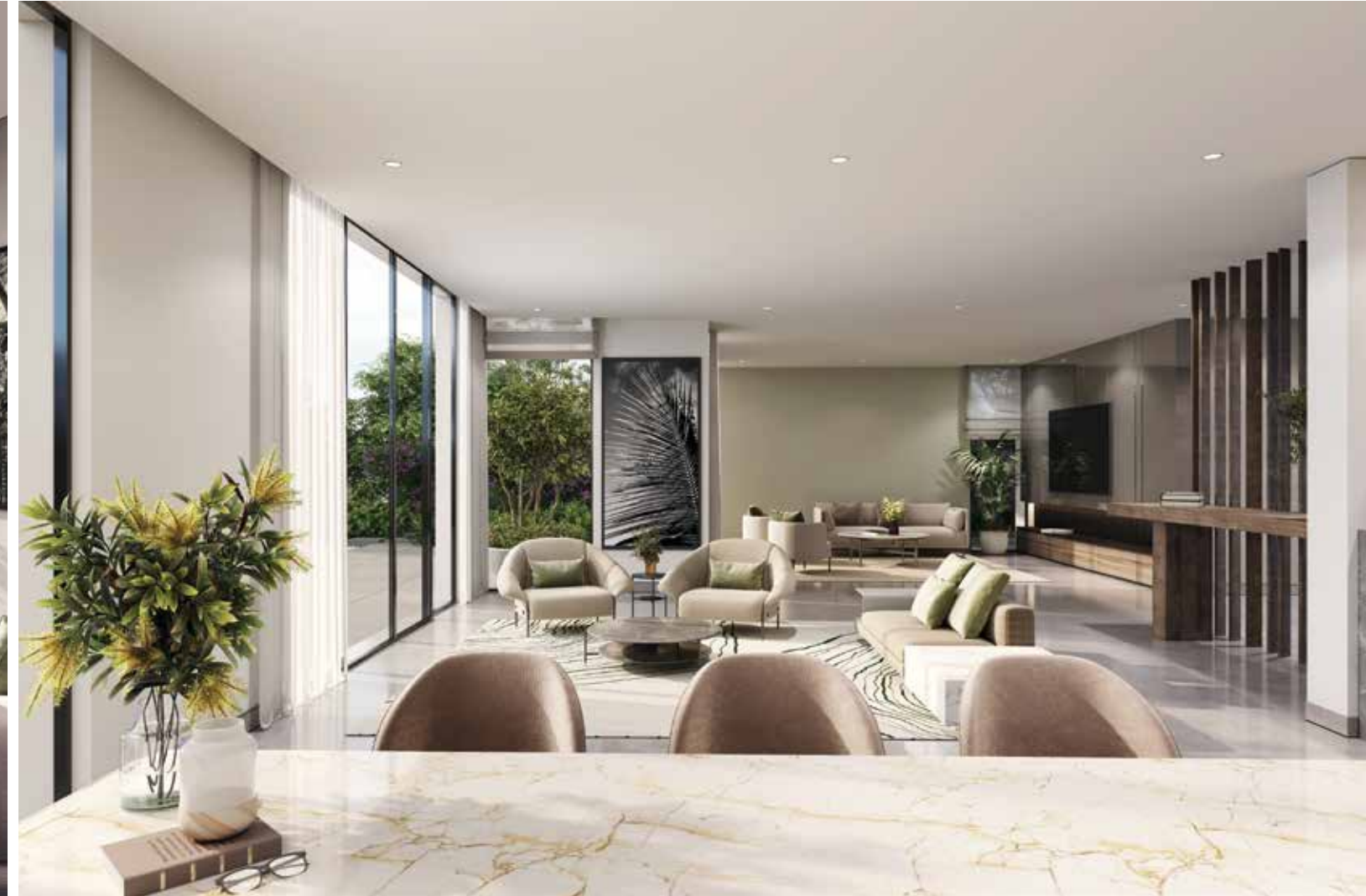
أيانا فلل جزيرة راقية بـ 6 غرف نوم