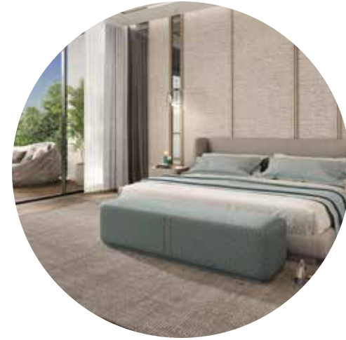
أجنحة رئيسية رحبة