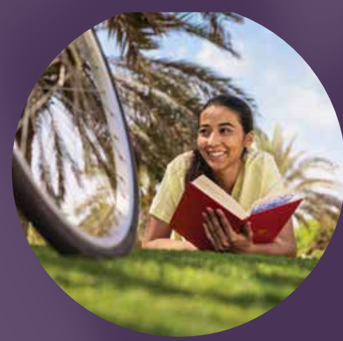
مدخل إلى الحديقة