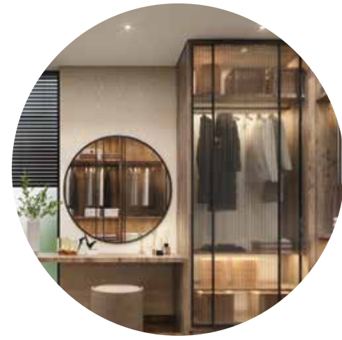
خزانة ملايس مدمجة