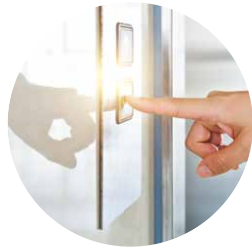
مصاعد منزلية في كل فيلا فارهة