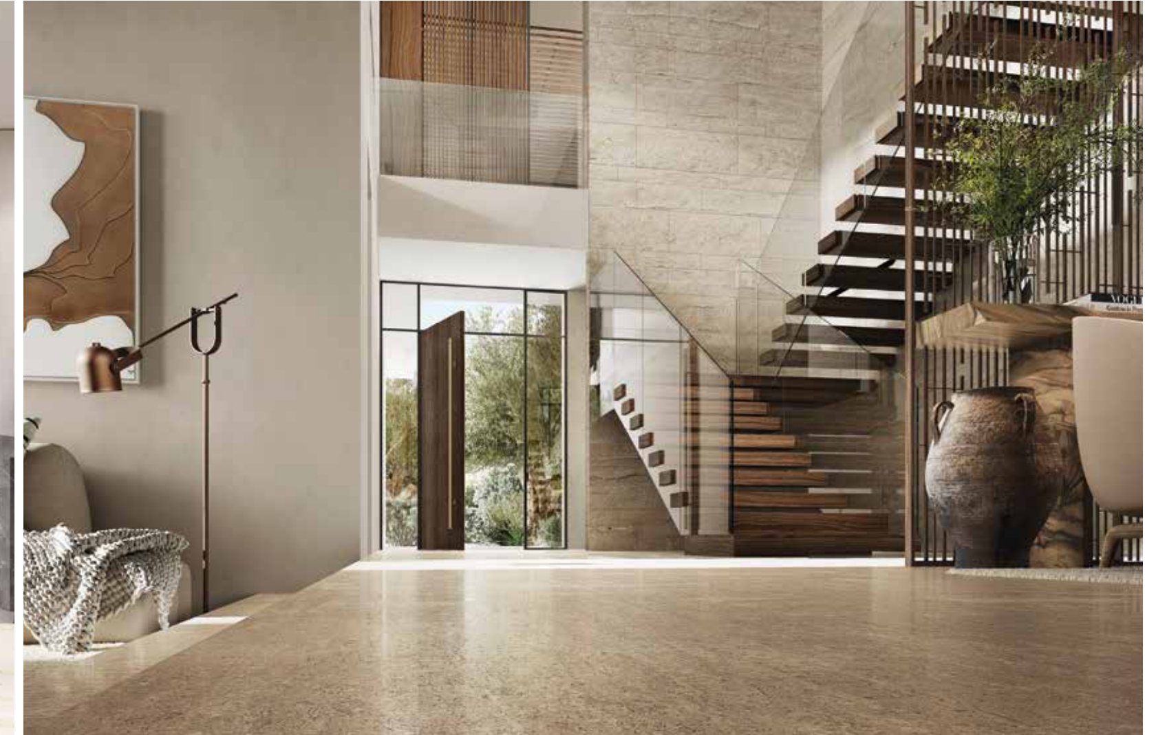
أليا فلل جزيرة فارهة بـ 6 غرف نوم