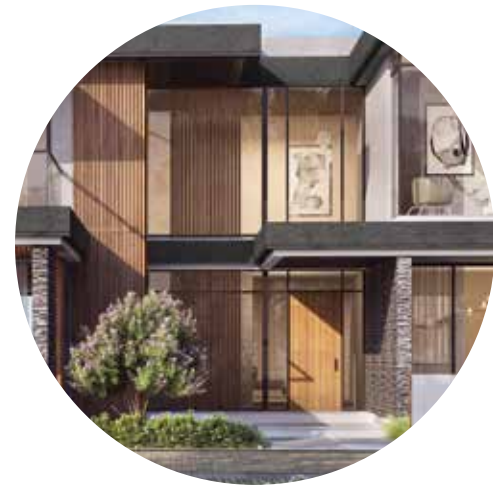
مدخل مذهب مزدوج الارتفاع