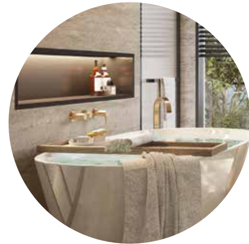
حمامات ملحقة على نمط السبا