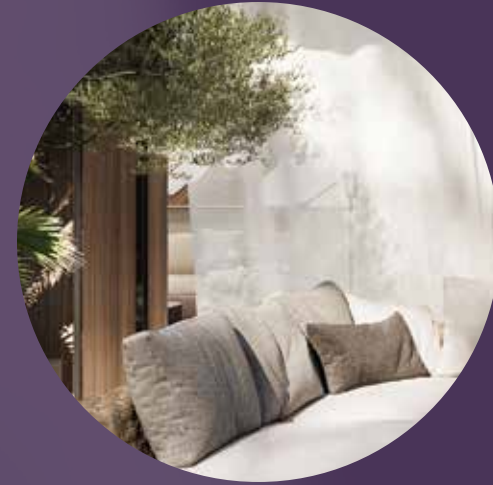
شرفات وبلكونات مظلمة