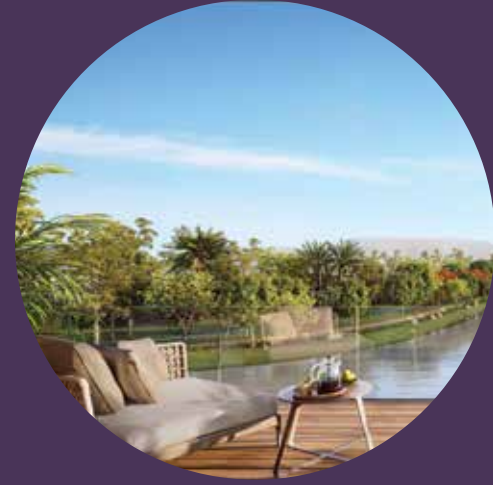
إطلالات ساحرة على البحيرة