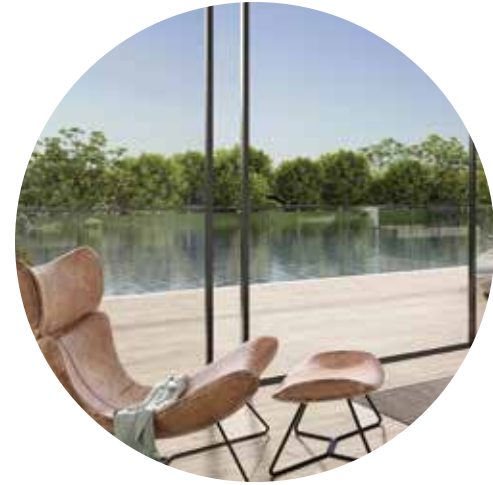
نوافذ تمتد من الأرض إلى السقف